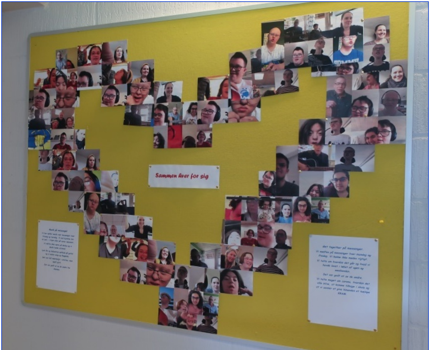
Collage på gangen lavet af en gruppe elever. Hjertet indeholder mange skærmprents fra "coronapausen", hvor kontakten mellem hjemsendte elever og personale foregik digitalt.

Elevprodukter på fællesarealer og i grupperne kan være værdifulde fx for den enkeltes identitet eller sammenholdet i en gruppe.