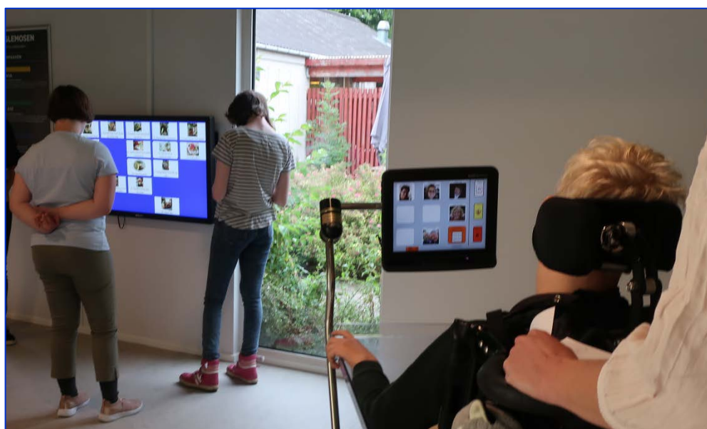
En elev med øjenstyret talecomputer taler om en person han tænker på. I baggrunden kø ved elev-receptionens infoskærm, hvor ugens smørrebrød kan ses og læses højt.

Maglemosen understøtter ungdomskulturen og elevers kommunikationsbehov gennem brug af billeder og video internt i den pædagogiske dagligdag og eksternt til at informere om skolen.